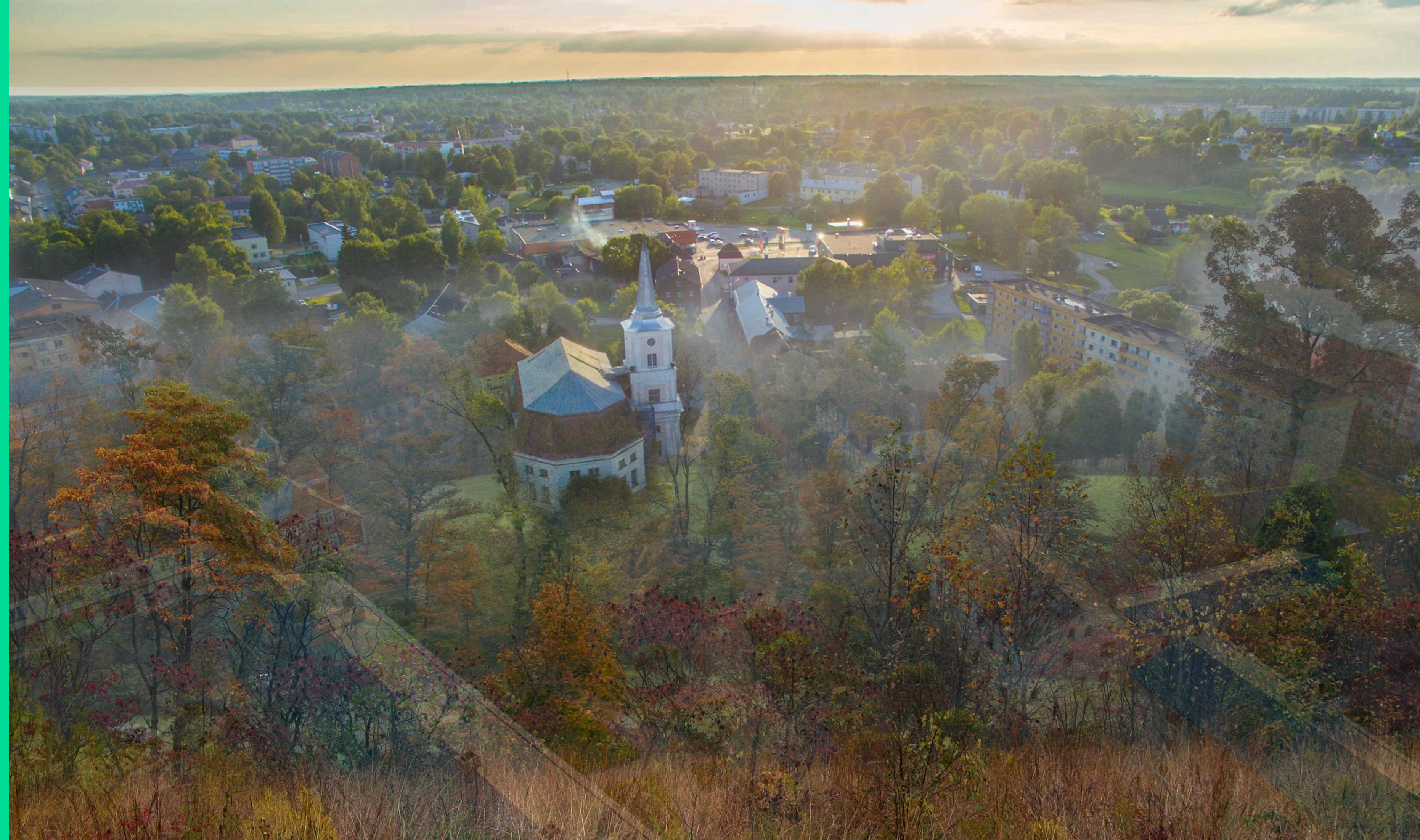
Tudengite uurimustöö töövisuaal Eesti Kunstiakadeemia urbanistika ja sisearhitektuuri ühisstuudio Designing Decline piirilinnas Valgas 2017 sügis (autor Sean Tyler)