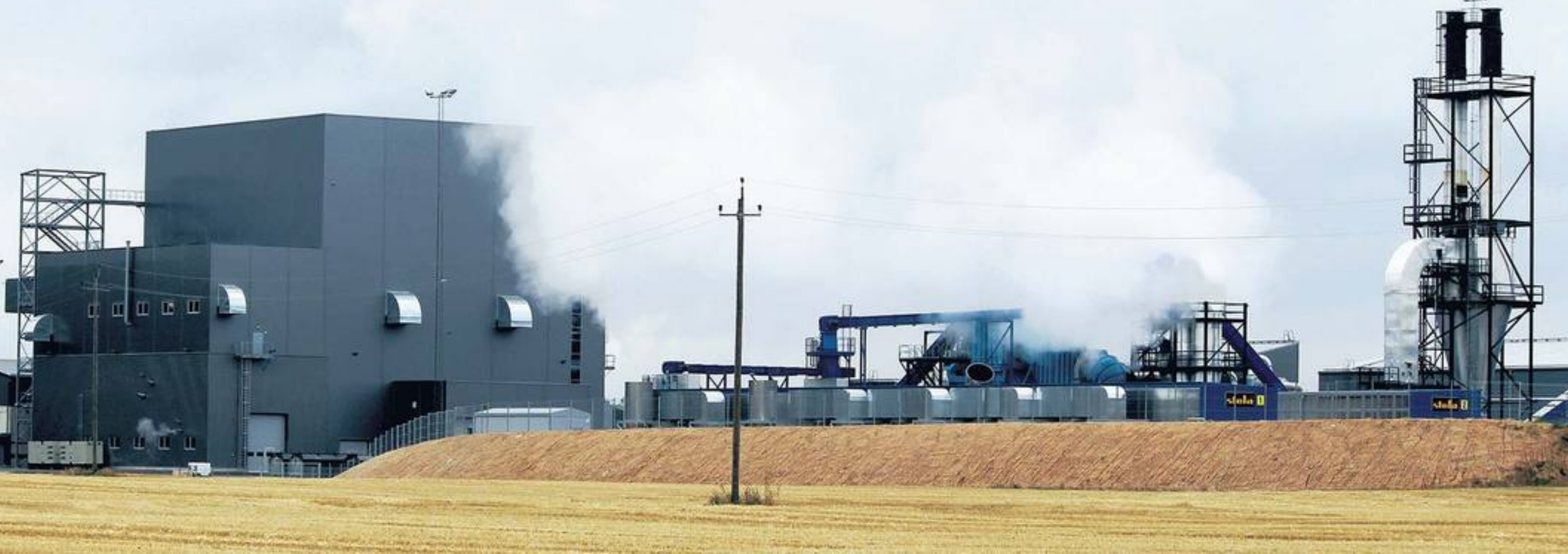
Pelletitootjal Graanul Invest Võrumaal Osulas asuv 10-megavatine koostootmisjaam, millesse investeeriti kokku 28,2 miljonit eurot.